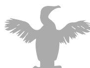
Cormorán de las Galápagos